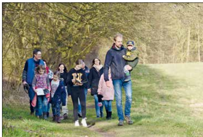
Auf dem Lebensweg die Ruhe genießen, diese Idee kommt in Süsel gut an.

Zu Ostern 2020 – mitten in der Zeit der Coronapandemie – war der Lebensweg eröffnet worden und wird seitdem rege genutzt. Seit der Eröffnung wurden 3500 Broschüren aus Papier mitgenommen. Aber auch die Online-Version wurde etliche Male heruntergeladen. „Die Menschen sind in Scharen diesen Weg gegangen, sicherlich auch als Ausgleich für die wegen Corona