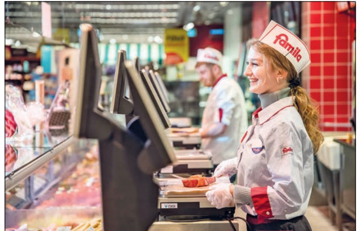
familia landete beim Deutschen Servicepreis 2023 mit 88,7 Punkten und dem Qualitätsurteil sehr gut auf Platz eins.

Das Deutsche Institut für Service-Qualität und ntv zeichnen jährlich die servicebesten Unternehmen mit dem Deutschen Servicepreis aus.