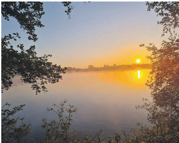
Werden hier schon bald Wohnhäuser stehen?