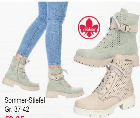
Sommer-Stiefel Gr. 37-42 59.95