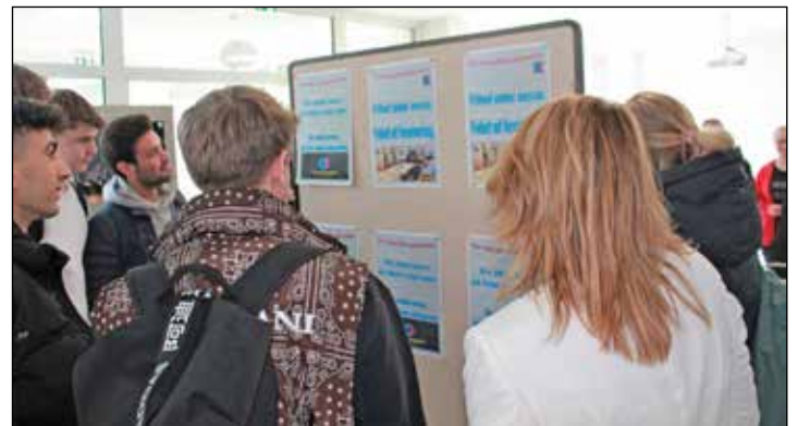
Deutsche und dänische Schülerinnen und Schüler betrachteten ein Ergebnis ihrer Arbeit.

len beigetragen.“ Die Lebensweisheiten der Befragten wurden auf Tassen, Ka-