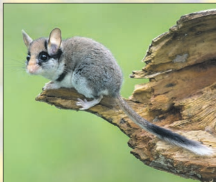
Gartenschläfer brauchen besondere Kästen.

Der BUND empfiehlt, verschiedene Arten von Nistkästen anzubieten. Das ist wichtig, weil der Kasten zum Vogel passen muss. Je nach Vogelart haben