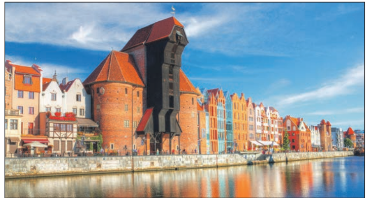
Die weltberühmte Hansestadt Danzig ist eines der Ziele der Tagesausflüge bei der Reporter-Rundreise in Polen.

lenden Berge“ sowie dem Erlebnis „Frisches Haff“ und Frauenburg. „Residieren werden die Reporter-Leser:innen im festen Standort-Hotel ohne lästigen Hotelwechsel am „Frischen Haff“ im guten Komfort-Hotel der Mittelklasse (Landeskategorie) in sehr zentraler Lage in Frauenburg mit deutschsprachigen Gastgebern und mit reichhaltiger Halbpension. Vom Hotel aus erfolgen die täglichen Ausflüge, die alle im Reisepreis mit enthalten sind, zu den Attraktionen des Landes mit deutscher Reiseleitung. Alle Infos und den