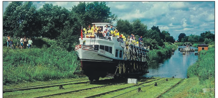
Über die „rollenden“ Berge erleben die Reporter-Leser eine ganz besondere Schifffahrt in Polen von Weltruhm.

Tour direkt ab Eutin sind ab sofort möglich bei den Reporter-Leser-Reisen in Eutin, täglich von 9 bis 13 Uhr, per Telefon 04521/701130 oder direkt per Mail unter leserreisen@der-reporter.info .