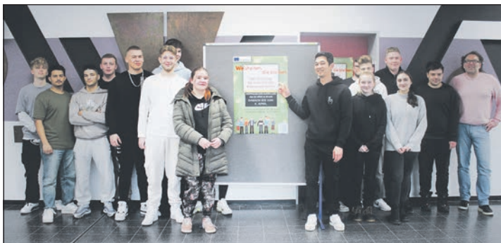
Die Wirtschaftsklasse freut sich auf die Ausstellung in der Pausenhalle.

Die Zitate wurden auf Produkte gedruckt, die nun ausgestellt und zum Verkauf angeboten werden. Neugierig geworden? Die Ausstellung ist bis zum 5. April in der Beruflichen Schule in der Wilhelmstraße 6 zu sehen.