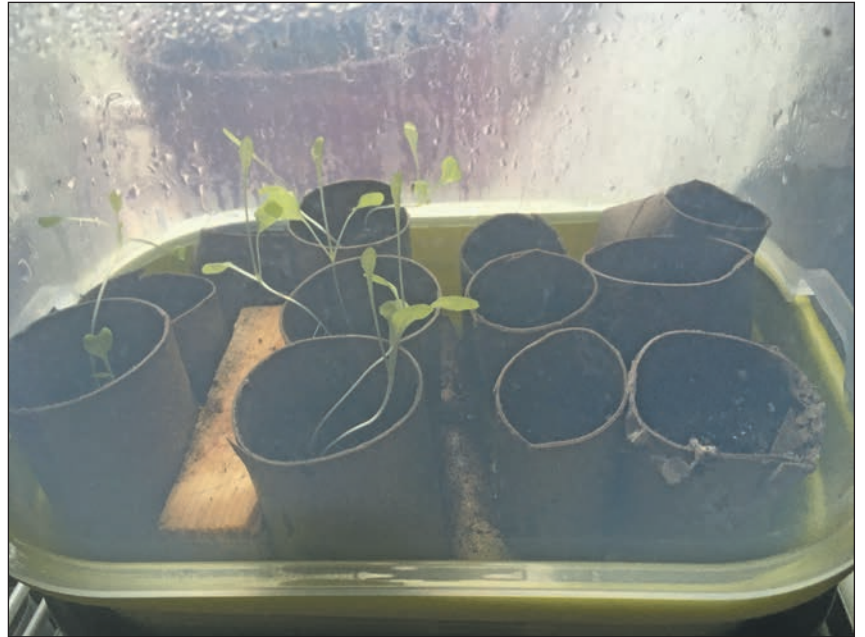
Pilotprojekt ABC-Aussaart: Blumenkohl (kommt noch nicht), Chili (auch nicht), Endivie (immerhin).

zumuten will, diese zahllosen Pöttchen zu gießen. Und dann das Trauerspiel, wenn doch was eingeht, nö. Das gebe ich zu Bedenken und er sagt: „Jaha, aber ich mach ja ein Bewässerungssystem.“ Echt jetzt? Einmal quer durchs Wohnzimmer? kriege ich ein bisschen Angst. „Nee, ich stell alles in den Folientunnel und lege da einen Schlauch mit kleinen Löchern rein, ferngesteuert von einer Zeitschaltuhr“, erklärt er stolz. „Und ganz viel kann ja auch schon vor dem Urlaub raus ins Beet.“ Nicht, dass schon Beete fertig wären, also durchgegraben und so. Ging ja auch nicht. War Schnee, dann nass und so. Keine Ahnung, wie die Angebergärtner in der Nachbarschaft das machen, frisch umgegrabene, schön glatte Beete, die nur auf Setzlinge und Saatgut warten. Wer gräbt um? frage ich. Doch solche profanen Kleinigkeiten sind nicht des Tomatengärtners Sache. „Das machen wir schon“, sagt er nonchalant. Ich höre immer „wir“. Eine Freundin erzählt, dass ihr Mann – ein guter Freund, obwohl Seelenverwandter des Tomatengärtners, wenn es um den Anbau von Gemüse geht – jetzt ein zweites Beet anlegt. Zweites Beet ist hier bei einem riesigen Grundstück ins richtige Größenverhältnis zu setzen – sie meint eigentlich eine Art zweiten kleinen Gemüsegarten