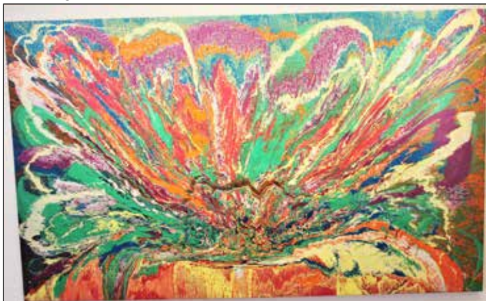
Das 1,50 x 2,00 m große Bild heißt „Schmetterlingstränen“. Mit über 40 Liter Farbe ist es ein beeindruckender Hingucker.

frage einer renommierten Galerie vor. Wer übrigens auf den Bildern eine Signatur des Künstlers sucht, sucht vergeblich. „Meine Bilder sollen für sich sprechen, da stört eine Unterschrift nur. Deshalb signiere ich auf der Rückseite“, sagte Schwien und berichtete, dass es zu einigen Bildern auch Gedichte gibt, die dann ebenfalls auf dem Bildrücken stehen. Und wer Freude an absolut bemerkenswerten Farbkombinationen hat, die dem Betrachter auf eindrucksvolle Weise die Gefühle des Künstlers widerspiegeln, für den ist der Museumsbesuch ein Muss.