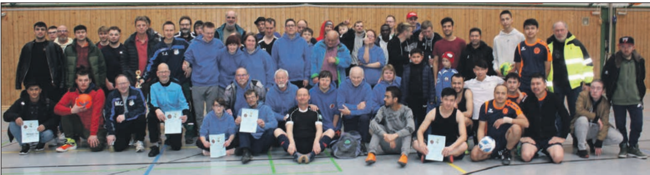
Alle Beteiligten des Fun-Turniers

es nicht. Nach dem Finale, um 14.10 Uhr, standen die Platzierungen dieses Fun-Turnieres fest. Die Podiumsplätze belegten: 1. TSV Fissau,