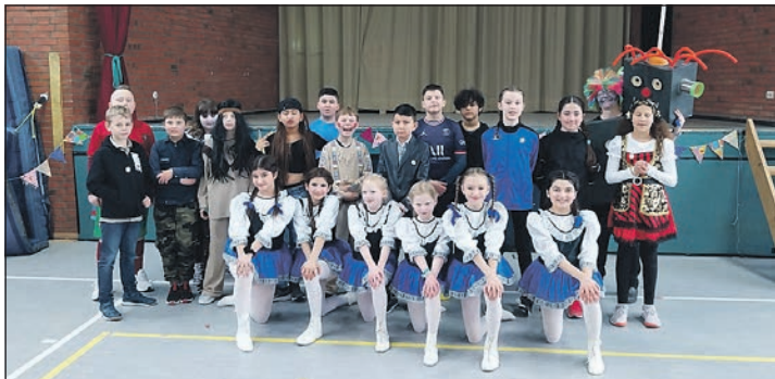
Sechs Mädchen aus der Klasse 4d boten den Schülern und Schülerinnen eine tolle Choreografie.