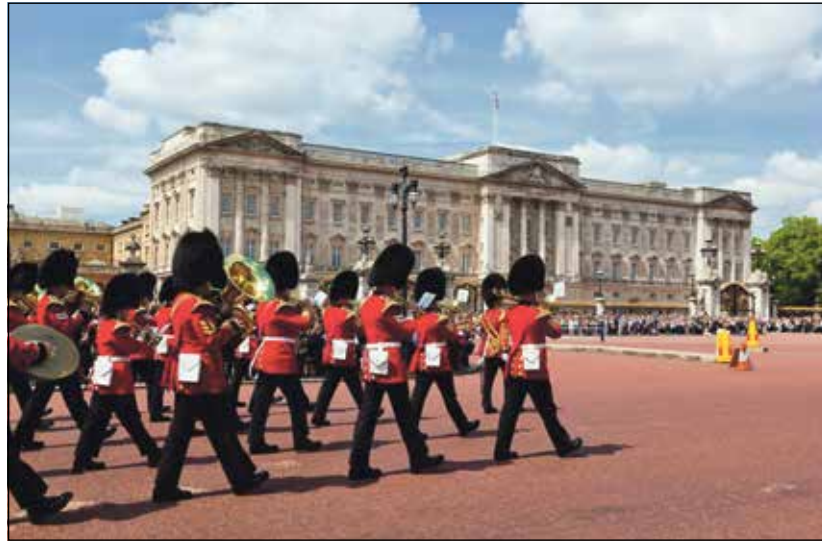
Ein Höhepunkt jeder Stadtrundfahrt: Die große Wachablösung in London am Buckingham Palace

Die Welt-Metropole an der Themse erwartet unsere Leser zum grenzenlosen Shopping am langen Feiertags-Weekend zu Ostern mit eleganten Shops, weltberühmten Kaufhäusern, Outlets, Museen und farbenprächtiger Wachablösung am Buckingham Palace! Als besonderen Reise-Tipp offerieren die Reise-Experten die Möglichkeit der Zubuchung der großen, ca. dreistündigen Stadtrundfahrt in London zum Aufpreis von 25 Euro zu den