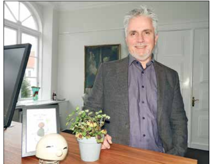
Zuversichtlich angesichts großer Aufgaben: Bürgermeister Sven Radestock

Zu den Themen, die Sven Radestock im Fokus sieht, gehört das von ihm vielbeschworene Wir-Gefühl: „Das beginnt bei der Kommunikation innerhalb der Verwaltung. Zudem muss der Dialog von Verwaltung und Bürger*innen verbessert werden“, führt er aus. Die Verwaltung sei als Teil der Stadt Teil des Miteinanders und das will er konstruktiv und menschlich gestalten. Beschreibungen, die auch für den innerstädtischen Verkehr wünschenswert sind. Es gelte, für die verschiedenen Rollen zu sensibilisieren: „Denn wir werden immer auf Rücksicht angewiesen sein“, unterstreicht Radestock. Ohne Umschweife gibt der grüne Bürgermeister ein Ziel vor: „Am meisten Platz hat derzeit der Autoverkehr. Das muss sich ändern!“ Er selbst legt seine Wege, auch die offiziellen, wenn möglich mit dem