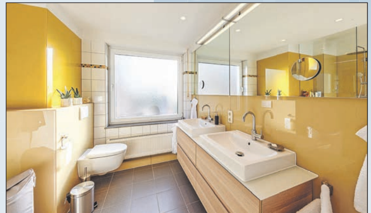
...verleihen dem Badezimmer das gewisse Etwas.

mit dem Spiegel: War er früher eher zu klein, um sich zu zweit für den Tag zu richten, sind heute große, gerne auch sehr breite Spiegel gefragt, die Platz für jede Schlafmütze im Raum bieten. Wunderschön sind schließlich auch maßgefertigte und dank des fugenfreien Materials besonders hygienische Wandverkleidungen aus Glas, die üblicherweise aus rückseitig lackiertem oder emailliertem Einscheiben-Sicherheitsglas, so genanntem „ESG“, gefertigt werden. Sie können sogar auf die alten Badezimmerfliesen geklebt werden – das aufwändige und mit viel Schmutz verbundene Abschlagen der alten Fliesen entfällt also. „Farbbeschichtete Gläser, die es in allen RAL Farben gibt, setzen ganz individuelle und besonders brillante Akzente“, so Grönegräs. Sanitärmöbel können dann ganz normal auf das Glas an die