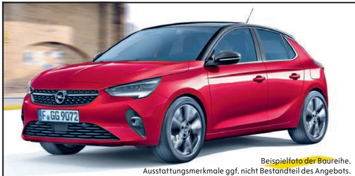
Beispielfoto der Baureihe. Ausstattungsmerkmale ggf. nicht Bestandteil des Angebots.