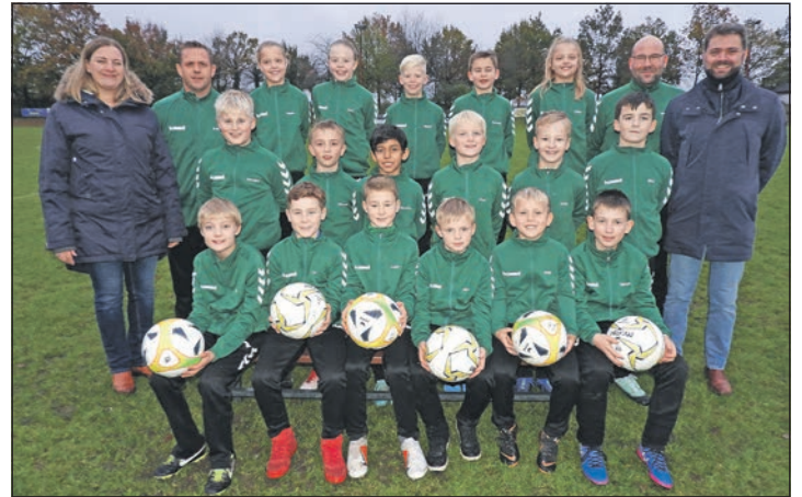
Perfekt ausgestattet: Von der Tischlerei Mielke gab es einen Satz Trainingsanzüge für die E-Jugendmannschaft.

kes gehört zu den 20 Kindern, die zweimal wöchentlich von Michael Klemp trainiert werden. Dazu kommen die regelmäßigen Punktspiel-Termine an den Wochenenden. Dort wird man künftig stillet in Süseler Grün anreisen. Individuell werden die schicken Sportanzüge dank der aufgeflockten Vornamen. Die perfekte Ausstattung für die jungen Fußball-Talente, die ihren Sport lieben und deutlich auskunftsfreudiger waren als manche ihrer Profi-Kollegen: „Ich spiele schon mein ganzes Leben