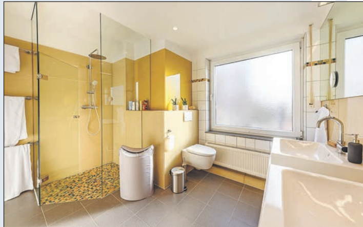
Eine gläserne Dusche, großformatige Spiegel und Wandverkleidungen aus Glas...

Ostholstein (t). Jeder Raum im Haus oder der Wohnung kommt irgendwann in die Jahre. So auch das Bad, das in vielen älteren Gebäuden noch den teils fragwürdigen Charme der 1960er- und 1970er-Jahre versprüht. Der Bundesverband Flachglas (BF) zeigt, wie sich mit Glas aus einem biedereren Waschraum eine moderne Wellness-Oase zaubern lässt.