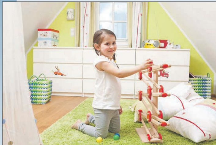
Unter einem gut gedämmten Dach wohnt es sich behaglich.

Ostholstein (t). Hausbesitzer, die dauerhaft Energie einsparen möchten, können damit ganz oben anfangen: mit der Sanierung des Dachs. Denn Erfahrungen zeigen, dass die Oberstübchen in Altbauten vielfach nur unzulänglich oder gar nicht gedämmt sind. Schon aufgrund der großen Dachfläche, die ungeschützt Wind und Wetter ausgesetzt ist, geht somit viel teurer bezahlte Heizwärme verloren. Bis zu 30 Prozent der Gesamtenergieverluste in älteren Gebäuden gehen auf das Konto des Obergeschosses. Um dies zu ändern und dauerhaft Geld zu sparen, sind bei der Sanierung einige Faktoren zu beachten.