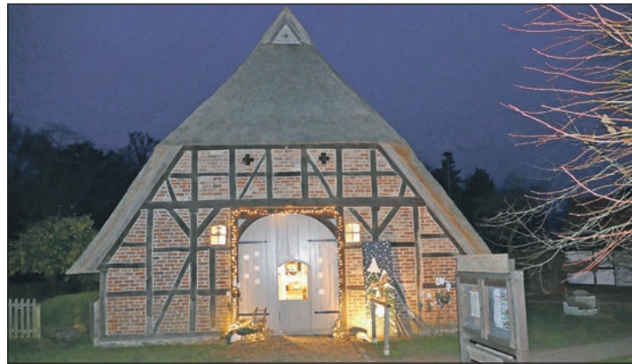
Stimmungsvoller Ausstellungsort: die Dunkersche Kate in Bosau.