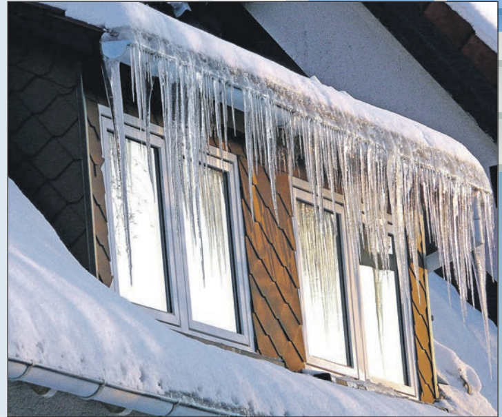
Im Winter gilt: Fenster kurz ganz auf und Heizung aus.

Ratekau, Zeiss-Straße 34, ☎ 0 45 04 / 60 94 29 www.dasgelbeofenhaus.de