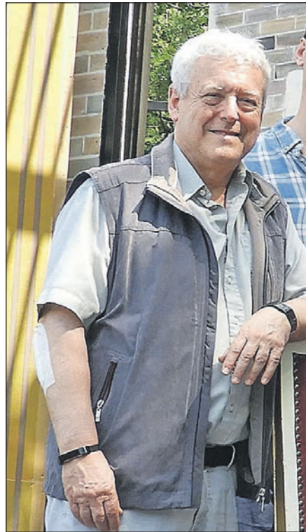
Bereich Klassik der Festspiele. Der gebürtige Engländer ist 70 Jahre alt und mittlerweile auch