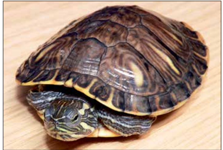
Diese Schildkröte wünscht sich ein Zuhause...

Diekstauen 5 · Eutin · Telefon 0 45 21 / 7 36 44