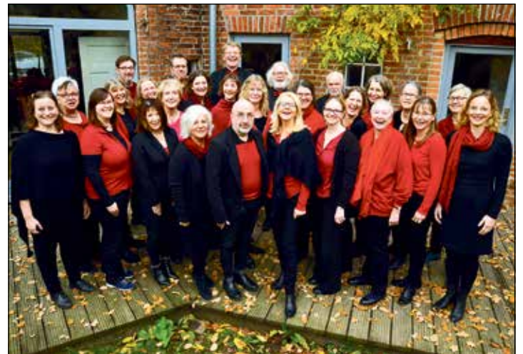
Vocupella feiert 20jähriges.

Kleinmeinsdorf (t). Das erste Jubiläumskonzerten gibt der gemischte Chor Vocupella aus Eutin am