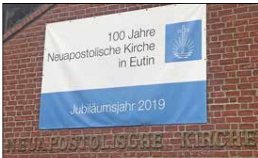
Die Neuapostolische Kirche feiert in diesem Jahr ihr 100-jähriges Jubiläum und sammelte am „Tag der offenen Tür“ Geld für das Hospiz.