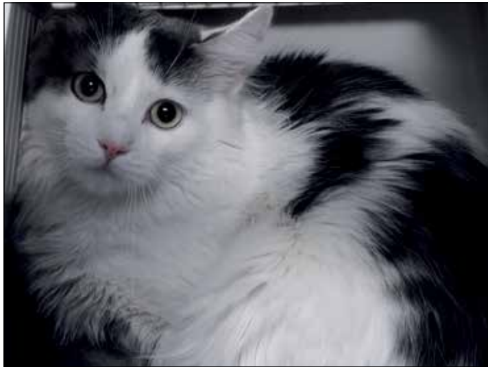
... genau wie dieser hübsche Kater

noch nicht auszumachen ist, einen Sommer-Teich und ein geeignetes Winterquartier bieten kann, ist eingeladen im Tierheim Bekanntschaft zu schließen. Dort wartet auch Kater Leon auf nette Menschen, die ihn in ihre Familie aufnehmen möchten. Im August 2018 geboren ist er noch ein richtiger Jungspund, der umständehalber von seiner Besitzerin abgegeben wurde. Sein schönes Fell legt die Vermutung nahe,