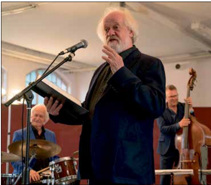
Augenzwinkernd wird die tränentreibende Geschichte um Liebeslust und Liebesleid erzählt.

Liebesleid erzählt, swingt sich das Harald-Rüschbaum-Trio durch sämtliche Carmen-Arien