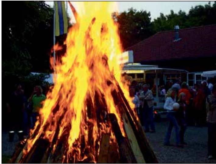
Die Schützengilde lädt zur Sommersonnenwende ein.

Eutin (t). Die Eutiner Schützengilde von 1668 lädt alle am Freitag, 21. Juni, zum immerhin schon 47. Mal, zu ihrem Traditionsfest der Sonnenwendfeier ein. Das hoffentlich schöne Sommerwetter ist ein idealer Zeitpunkt, um eine Freiluftveranstaltung dieser Art stattfinden zu lassen. Um den 21. Juni herum, steht die Sonne scheinbar direkt senkrecht über dem nördlichen Wendekreis der Erde. Die Nacht der Sommersonnenwende ist die kürzeste in diesem Jahr und von diesem Zeitpunkt an werden die Nächte wieder länger und die Tage kürzer. Aus diesem Grund soll auf dem Vogelberg kräftig gefeiert werden. Es beginnt um 19.00 Uhr mit den