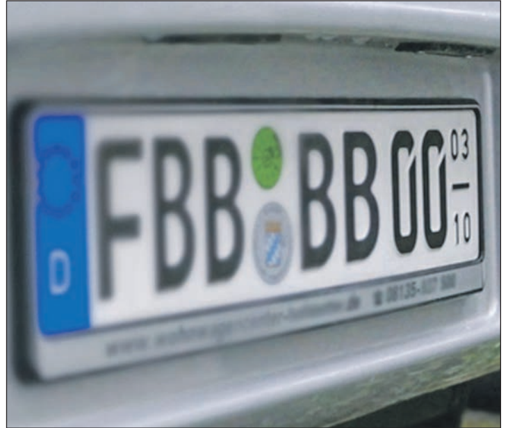
Gültigkeitsdauer rechts: hier vom 1. März bis zum 31. Oktober.

Ein weiterer Vorteil: Halter, die ihr Fahrzeug nicht das ganze Jahr nutzen, ersparen sich mit dem Saisonkennzeichen das kostenpflichtige Ab- und Anmel-