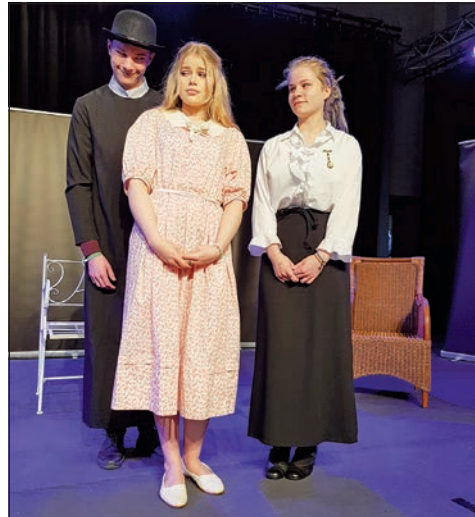
Cecily wird bedrängt von Dr. Chasuble (links) und Miss Prism (rechts)