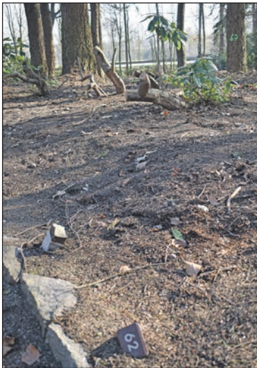
Die kleinen Grabsteine mit Nummern liegen teilweise zerstreut umher, im Hintergrund die stark zurückgeschnittenen Rhododendren.

Das gesamte Umfeld wirkt ungepflegt und wie nicht fertiggestellt. Vor kurzem wurden die zahlreichen Rhododendren zurückgeschnitten. „Der Rückschnitt der Sträucher ist meiner Meinung