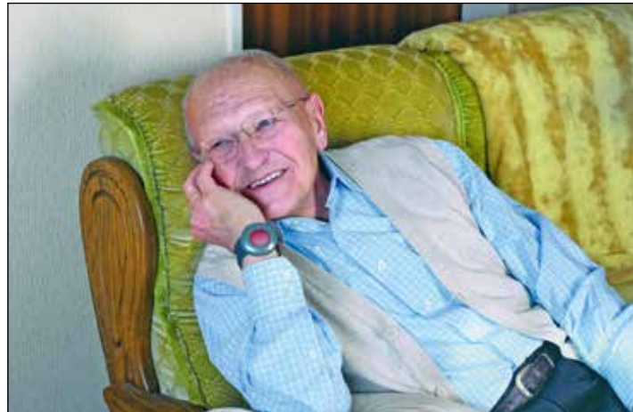
Sicherer lebt man im Alter mit den Hausnotruf des ASB.

Das Hausnotrufsystem besteht aus einer Basisstation und einem tragbaren Hausnotrufknopf, den es in verschiedenen Varianten gibt, zum Beispiel als Halskette oder als Armband. Beide Geräte