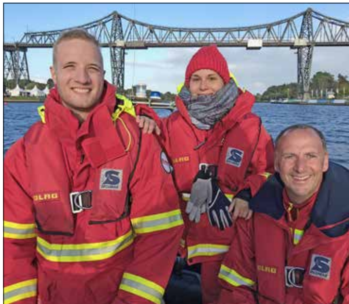
Einsatzkräfte der DLRG Eutin sicherten ein Ruder-Event.

Eutin e.V. bei verschiedenen Veranstaltungen aktiv.