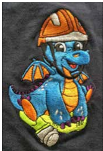
Furton, das Maskottchen der Eutiner Kinderfeuerwehr.

das Maskottchen der Kinderfeuerwehr, der Drache „Furton“, die Vorderseite zeigt das Eutin-Logo mit dem Schriftzug „Kinderfeuerwehr“ Zur Zeit gehören der Feuerwehr Eutin 70 Mitglieder in der Einsatzabteilung an. Die Jugendfeuerwehr hat 32 Mädchen und Jungen in ihrer Abteilung und die Kinderabteilung hat 19 Mitglieder. Außerdem gehören der Wehr 28 Ehrenmitglieder an.