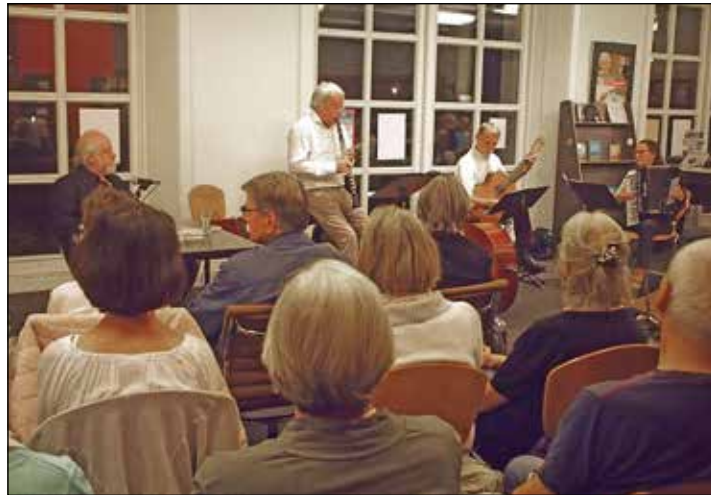
Die Hospizinitiative Eutin freut sich über eine gelungene Benefizveranstaltung zum Internationalen Hospiztag mit Musik und anregenden Gesprächen.