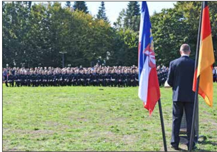
400 junge PolizeibeamtInnen wurden auf der Hubertushöhe feierlich vereidigt.