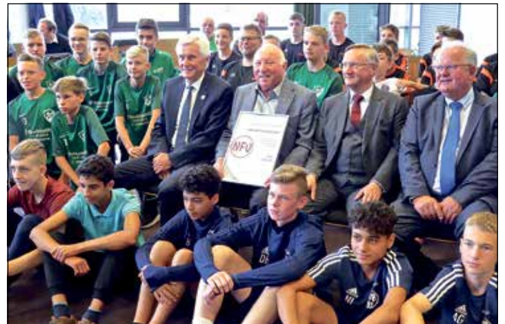
Im Kreis der Sport-Organisationen und zukünftigen „Fußballstars“ fühlt Uwe Seeler sich wohl.

den Teamgeist zu pflegen, nach der Parole: „Gemeinsam gewinnen wollen, aber auch gemeinsam verlieren können!“ (Wie aktuell!). Während der Feierstunde wurden die „Amputees Kids“, eine Initiative der Amputees Vita e.V., mit einem mit 50.000 Euro dotierten