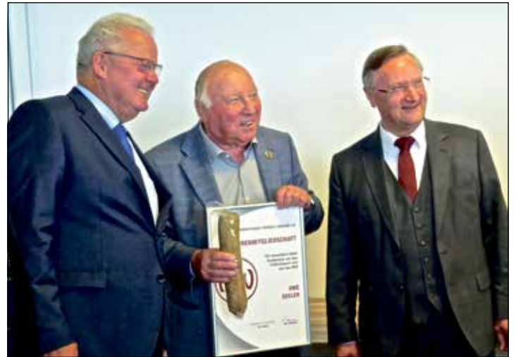
Eine Urkunde für Uwe Seeler zur Ehrenmitgliedschaft im NFV, überreicht durch Günter Distelrath, Präsident des Norddeutschen Fußballverbandes e.V. (r.) und NFV-Ehrenpräsident Eugen Gehlenborg. Als Zugabe nahm Seeler eine Leberwurst (sein Favorit unter den Würsten) lachend entgegen.

„Uwe Seeler ist im deutschen Fußball nicht wegzudenken. Er ist bodenständig, weltoffen und hat immer eine positive Einstellung zu den Dingen des Lebens. Er lässt sich nicht verbiegen,