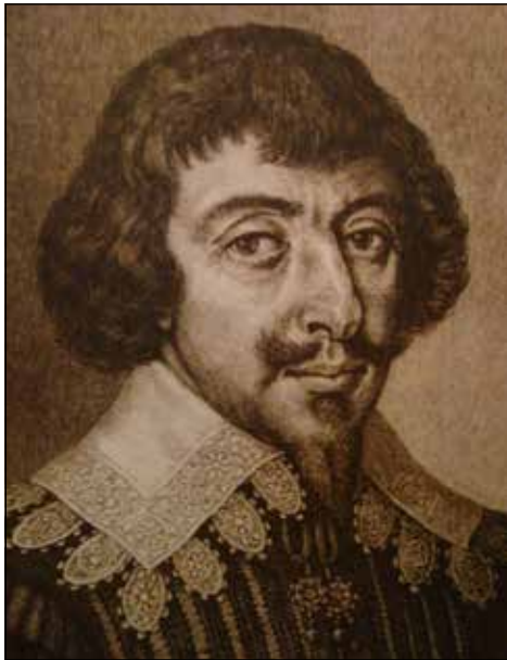
Martin Opitz gilt als Vater der deutschsprachigen Dichtkunst.