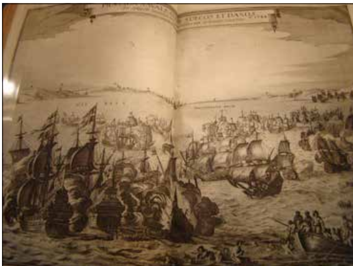
Die Schlacht vor Fehmarn 1644 hat - anders als hier dargestellt - kein Schiff gekostet.

des Krieges: Wo auf dem Stich dramatische Untergangsszenen zu entdecken sind, sei in Wahrheit kein einziges Schiff untergegangen, so Walter. So sind auch „Fake news“ keine Erfindung der Moderne: „Die Kanonen aber donnerten so laut, dass man es bis nach Lübeck hörte“, berichtet der Historiker. Erklärtes Ziel der Ausstellung ist es, Nähe herzustellen, ein Bewusstsein für die Aktualität zu wecken: „Was Krieg im Menschenleben anrichtet, das Verhängnis der Gewalterfahrung, davon wird hier Zeugnis gegeben“, meint Wolfgang Schiller. Die Notwendigkeit für eine solche bewusste Auseinandersetzung ist für die Ausstellungsmacher offensichtlich, denn wie Walter sagt: „Viel gelernt hat man nicht.“ Die Ausstellung ist bis zum 29. September während der Öffnungszeiten der Landesbibliothek dienstags bis freitags von 9.30 bis 18 Uhr sowie samstags von 9.30 bis 13 Uhr zu sehen. Der Eintritt ist frei.