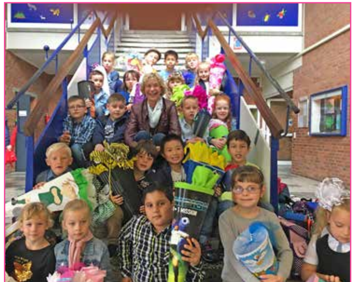
Klasse 1e der Gustav-Peters-Schule am Kleinen See