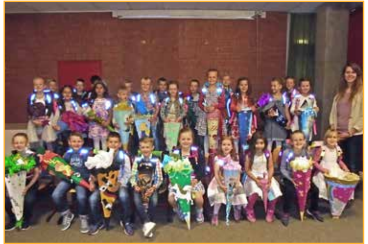
Klasse 1b der Gustav-Peters-Schule