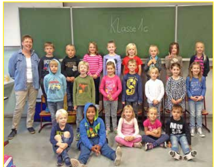
Klasse 1c der Grundschule Malente