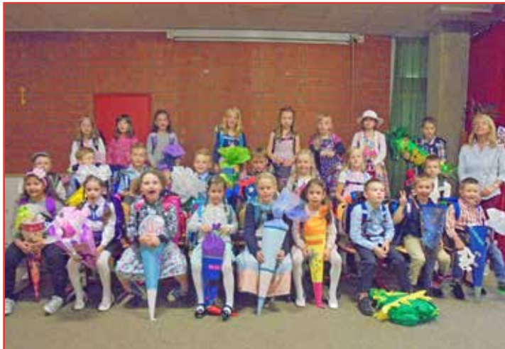
Klasse 1c der Gustav-Peters-Schule