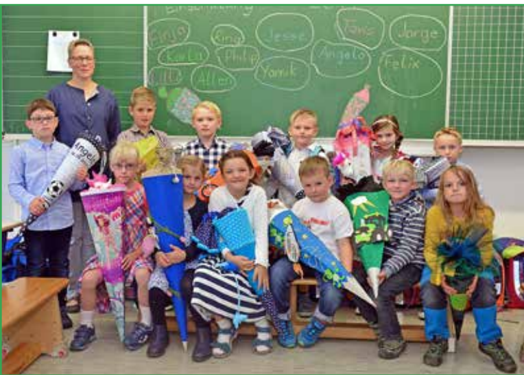
Klasse 1b der Grundschule Sieversdorf