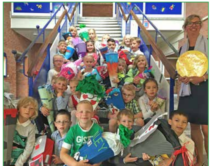
Klasse 1g der Gustav-Peters-Schule am Kleinen See