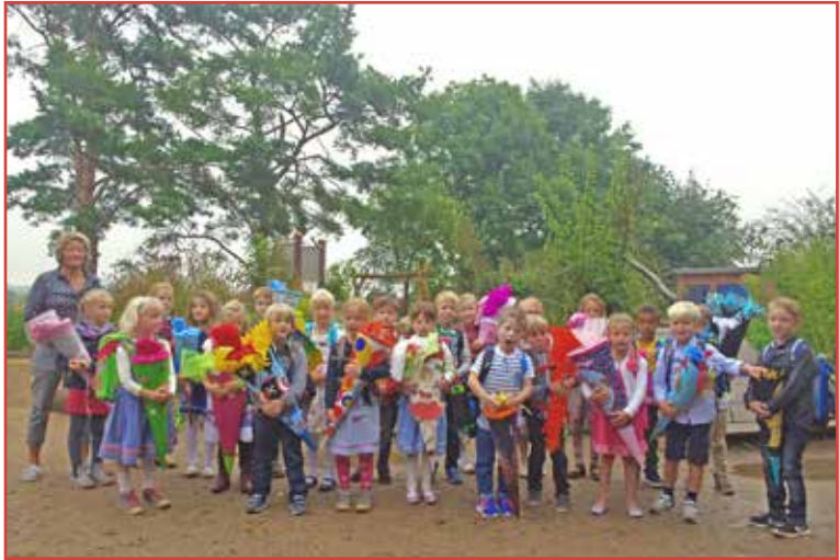
Klasse 1f der Gustav-Peters-Schule in Fissau