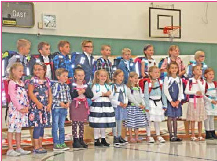
Klasse 1 der Heinrich-Harms-Schule in Hutzfeld