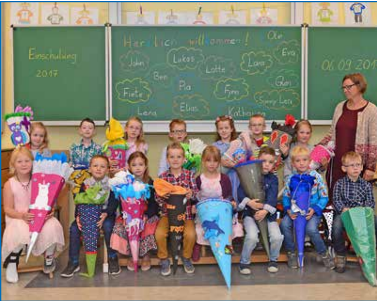
Klasse 1a der Grundschule Sieversdorf