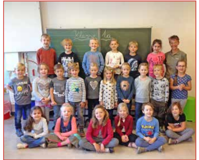
Klasse 1a der Grundschule Malente