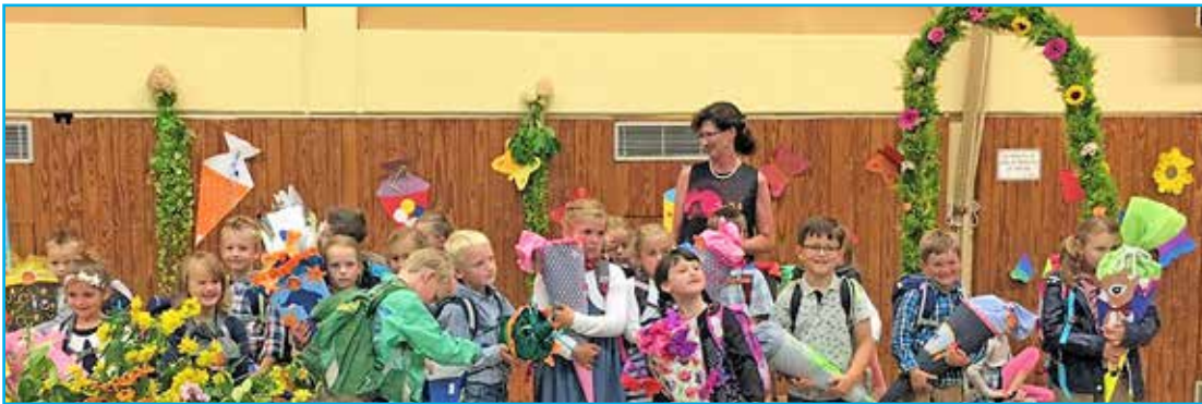
Die Klassen 1a und 1b der Grundschule Süsel.