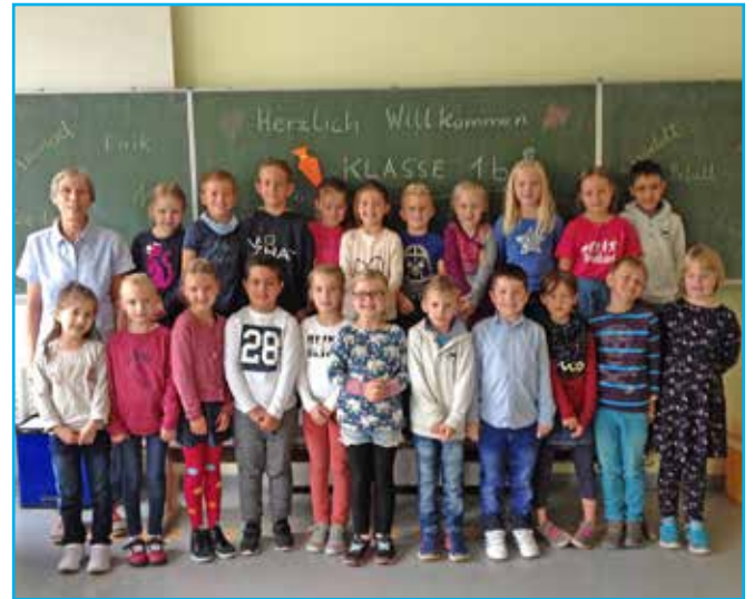
Klasse 1a der Grundschule Malente