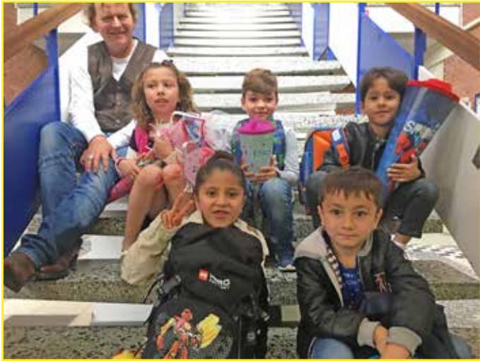
Die DAZ-Klasse der Gustav-Peters-Schule am Kleinen See