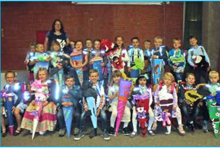
Klasse 1a der Gustav-Peters-Schule