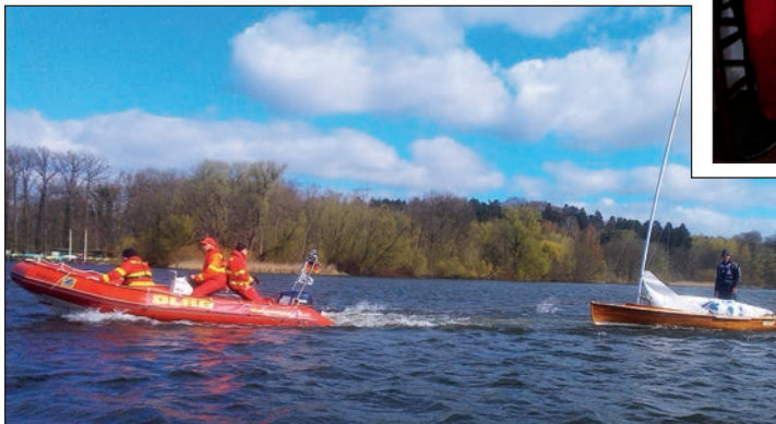
MRB (Motorrettungsboot) Malolo der Eutiner DLRG im Schleppesinsatz.

schwimmabzeichen in Bronze überreichte. Denn mit Abschluss des EH-Kurses hatten alle gleichzeitig auch ihr Abzeichen bestanden! Die DLRG gratuliert den Teilnehmern herzlich.