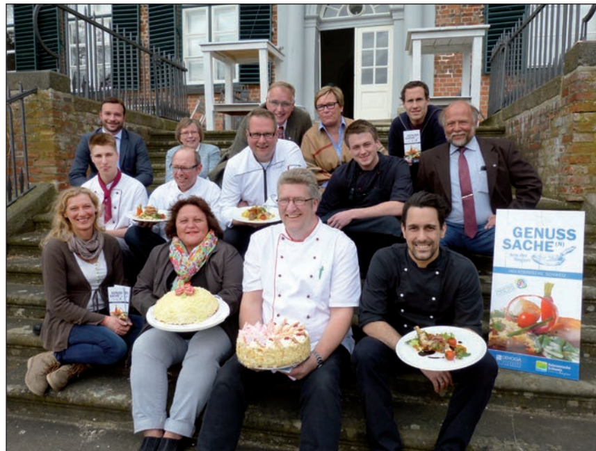
Elf Gastronomen der Region präsentieren im „GenussSache(n)“-Flyer der Dehoga ihre kulinarischen Kreationen im Jahr der Landesgartenschau.