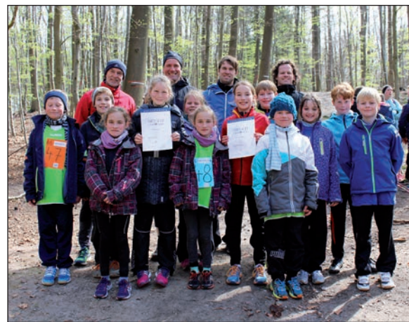
Als beste Grundschule qualifizierte sich die Mannschaft der Grundschule Lensahn.

Als zweite weiterführende Schule qualifizierte sich das Gymnasium am Mühlenberg aus Bad Schwartau mit einer Zeit von 2 Stunden und 56 Minuten. Das Freiherr-von-Stein-Gymnasium aus Oldenburg verpasste trotz eines Rückstands von bloß zwei Minuten das Helgoland-Ticket knapp. Der dritte und damit letzte freie Platz aus Ostholstein für den Staffelmарathon wurde an die schnellste Grundschule Lensahn, vergeben, die in der Gesamtwertung zwar mit einer Zeit von 3 Stunden und 2 Minuten den fünften Platz belegte, sich jedoch auf Grund der Sonderwertung für reine Grundschulmannschaften trotzdem für