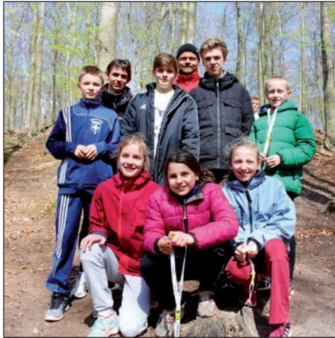
Auch die Mannschaft des Gymnasiums am Mühlenberg darf in Helgoland mitlaufen