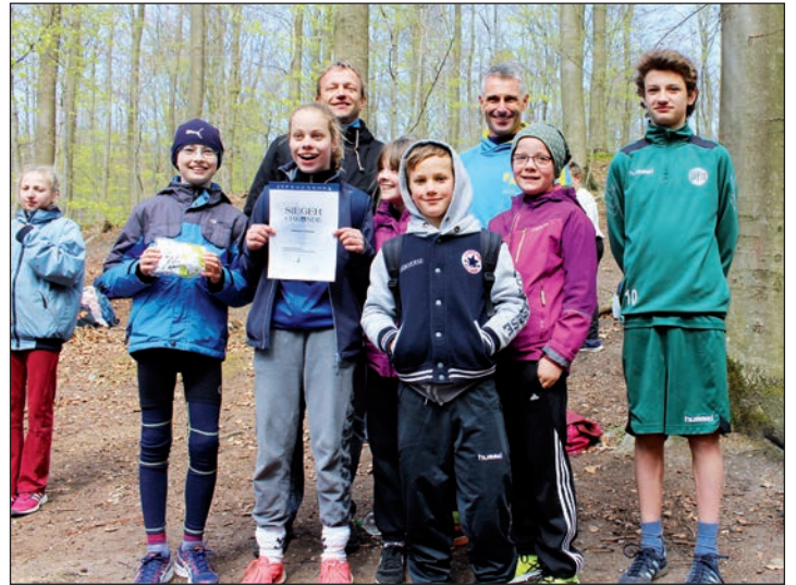
Das stolze Siegerteam der Voß-Schule freut sich auf die Fahrt nach Helgoland.

den Helgoland-Staffelmарathon qualifizierte. Das Schöne an diesem Wettbewerb sei die Zusammenarbeit und das Mannschaftsgefühl der Schüler, Eltern und Lehrer, betont