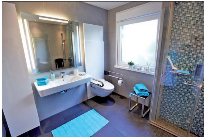
Bei der Badgestaltung an später denken: Mit viel Freiraum rund um Waschtisch, WC und Dusche, mit Haltegriffen und einem rutschhemmenden Bodenbelag wird die Einrichtung allen Generationen gerecht.

bei Neubau oder Modernisierung: Eine barrierefreie Einrichtung im Mehrgenerationenbad sorgt für das Alter vor - etwa wenn in Zukunft die Beweglichkeit etwas nachlassen sollte. Von der möglichst barrierefreien Badgestaltung kann man aber auch schon in jüngeren Jahren mit einem Plus an Komfort und Sicherheit profitieren. Ein rutschhemmender Bodenbelag etwa verhindert bei Kindern im Haushalt so manchen blauen Fleck - und ist später dann erst recht von Vorteil. Die neue Badeinrichtung ist das eine, die optimale Einplanung aller Wohnwünsche in dem zur Verfügung stehenden Raum das andere. Der erste Ansprechpartner ist daher der Experte aus dem Sanitär-Fachhandwerk: Er berät nicht nur umfassend zu allen Möglichkeiten, sondern setzt das barrierefreie Bad auch wirtschaftlich und in langlebiger Qualität um. Bodenebene Du-