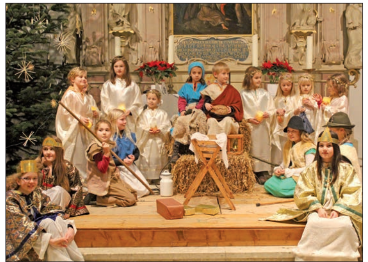
Auch in diesem Jahr gibt es Heiligabend ein Krippenspiel in der Schönwalder Kirche. Die Proben beginnen am 19. November.