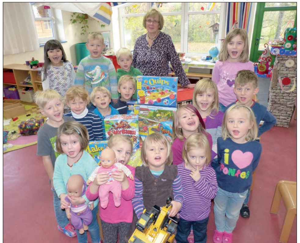
Die ganzen Spiele aus der neuen Spielothek passen gar nicht auf einen Tisch, so viele sind es – und die Schätze des Sarauer Kindergartens finden es super, sie auch für zuhause ausleihen zu können.

funden haben. Denn Spielen spielt bei der Entwicklung buchstäblich eine große Rolle – Kinder unterscheiden nicht zwischen Spielen und Lernen, so Dr. Manfred Spitzer, sie lernen spielend. Und das Paket ist so gut ausgestattet, dass es das Angebot eines Kindergartens perfekt