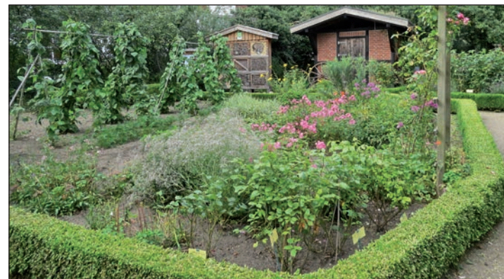
Gesucht wird jemand, der sich um die Kräuterbeete kümmern kann.

Am 7. November 2015 um 18 Uhr findet ein Liederabend in der Thomsen-Kate statt. Die Sängerin und Komponistin Alexandra Brüntrup besingt und intoniert am Keyboard Lebenssituationen, mal stimmungswaltig, mal in ruhigen Tönen. Sie wird begleitet von dem Schlagzeuger Joachim Krämer. Ein Adventsbasar findet am 21. November 2015 von 10 bis 17 Uhr in und vor der Thomsen-Kate statt. Hobbykünstler aus der Region bieten Keramik, Holzarbeiten, Adventsgestecke und Vieles mehr an. In der Kaffeestube gibt es selbst gebackenen Kuchen. Außerdem leckeren Katenpunsch und selbstgemachtes Schmalzbrot. Am 5. Dezember 2015 um 15.30 Uhr veranstaltet der Verein in der Thomsen-Kate einen gemütlichen Adventskaffee mit Rahmenprogramm für Mitglieder und Gäste. Der Eintritt zu allen Veranstaltungen ist frei. „Gegen eine kleine Spende gibt es keinen Einwand“, sagt der Vorsitzende Erichsen. Er weist darauf hin, dass der Heimatverein gerne jüngere Mitglieder in seinen Reihen sehen würde. Gesucht wird auch jemand für die Kräuterbeete im Bauerngarten an der Thomsen-Kate, jemand, der oder die ein wenig davon versteht und fachliche Anweisungen geben kann.