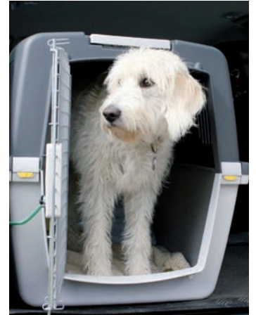
Tiere gehören im Auto in eine stabile Transportbox.

nerstädtischen Verkehr üblichen Geschwindigkeiten durch einen abrupten Unfallstopp Gegenstände – und auch Tiere – so beschleunigt werden können, dass sie mit dem 30- bis 50-Fachen ihres Eigengewichts durch das Auto fliegen. Das belegen auch Crash-Tests mit unterschiedlich schweren Hunde-Dummies: In den Simulationen zeigte sich, dass der Vierbeiner auf der Hutablage bei einem Unfall schnell zu einem für die vorderen Passa-