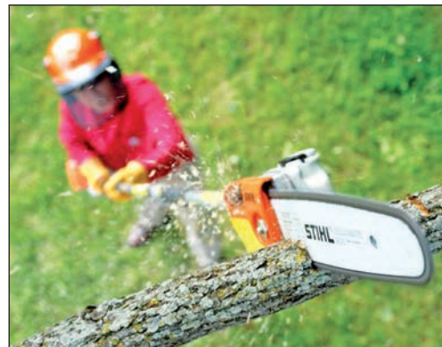
Wer seine Obstbäume im Herbst kräftigt stutzt, regt ein gesundes Holzwachstum für die kommende Gartensaison an.

das Grün in ein Meer aus leuchtenden Farben. Außerdem können sich Hobbygärtner vor der Winterpause noch einmal an der Ernte erfreuen, zum Beispiel von Äpfeln, Kürbissen und Feldsalat. Jetzt ist aber auch die richtige