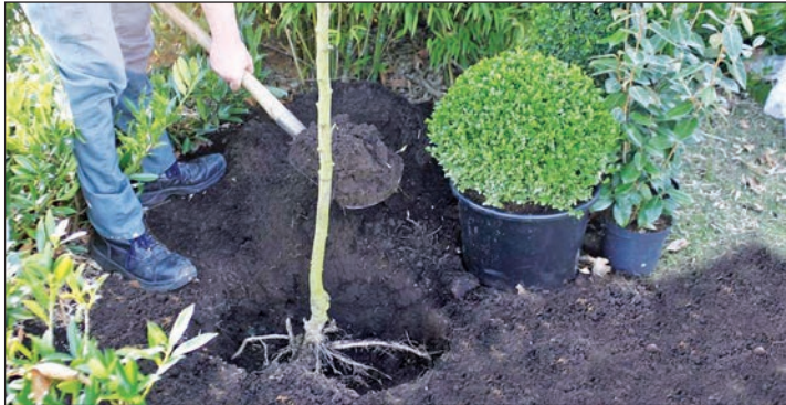
Im Herbst wartet jede Menge Arbeit im Garten: Jetzt ist die beste Pflanzzeit. Gerade die Wachstumsphase in diesen Wochen ist besonders wichtig.

lung. So können sie etwa das Wurzelvolumen der Pflanze und damit die Fähigkeit, Nährstoffe und Wasser aufzunehmen, deutlich erhöhen. Standard-Erden hingegen können den speziellen Bedarf junger Pflanzen oft nicht ausreichend bedienen - dabei ist die frühe Wachstumsphase während der ersten vier bis sechs Wochen besonders wichtig. Damit genug Luft und Wasser gespeichert werden, enthält die Pflanzerde daher hochwertige Kokos-, Weißtorf- und Schwarztorffasern. Die Spezialbehandlung zeigt spätestens im kommenden Frühjahr die gewünschten Resultate: Der Hobbygärtner verbessert das Anwachsen der kostenintensiven Neuanlagen, die Pflanzen sind widerstandsfähig und weniger empfindlich gegen Frost, Trockenheit- oder Wachstumsstress - und können im nächsten Gartenjahr buchstäblich aufblühen.