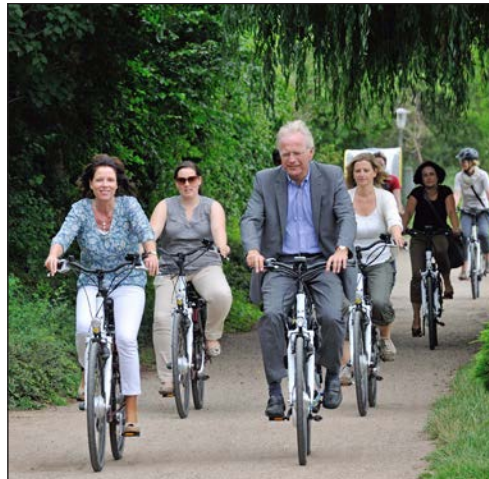
Mit E-Bikes ausgestattet machten sich die Plöner Landrätin Stephanie Ladwig und Ostholsteins Landrat Reinhard Sager auf den Weg durch die holsteinische Urlaubsregion.

Die gemeinsame Kreisbereisung von Landrätin Stephanie Ladwig und Landrat Reinhard Sager mit Vertretern der Tourismuszentrale Holsteinische Schweiz stand dieses Jahr ganz im Zeichen der naturtouristischen Marketingkampagne „Nachtgeflüster“. Gemeinsam mit der Tourismuszentrale Holsteinische Schweiz haben regionale Partner im Rahmen dieser Kampagne ein rundum neues und vor allem regionstypisches Angebot entwickelt, das Urlaubsgästen und auch Einheimischen in den Sommermonaten Möglichkeiten und Aktivitäten nach Einbruch der „Blauen Stunde“ zeigen soll – ein schöner Ferientag muss nach Einbruch der Abenddämmerung noch nicht zu Ende sein, so die Idee. Auch nicht für „kleine Urlauber“... Im Mittelpunkt stand dabei die enge Verknüpfung von Kultur und Natur, Grundlage und Garant für besonders sinnliche und nachhaltige Erlebnisse. Einige dieser Angebote in Verbindung mit den Besonderheiten des Kreisgebietes konnten Landrätin Ladwig und Landrat Sager im Rahmen der Bereisung näher kennen und ihre touristische Bedeutung schätzen lernen. Claus-Henrick Estorff von der Kreisjägerschaft Plön begleitete den „Abstecher“ durch „Feld und Flur“ in der Nähe von Gut Behl. Denn insbesondere die Ausflüge in die verschiedenen Jagdgebiete