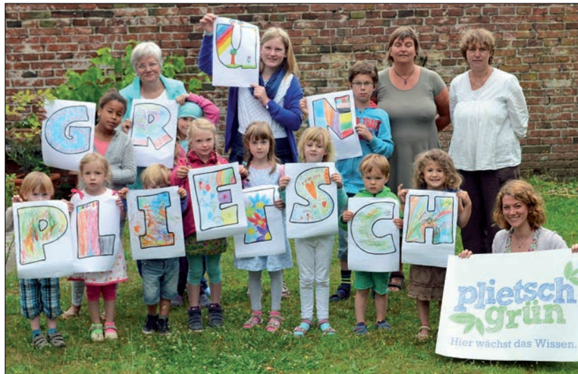
Kinder des Montessori Kinderhauses präsentieren sich „plietsch grün“.

Bildungsprogramm der LGS Eutin 2016 eine eigene und einzigartige Identität: Für norddeutsch schlau/klug/verständlich/aufgeweckt steht das Wort „plietsch“. Dieses wird häufig in Zusammenhang mit Kindern verwendet. Darüber hinaus stellt es einen direkten Bezug zwischen der Landesgartenschau und Eutin als norddeutschem Standort her. Der Farbenbegriff „grün“ ist verknüpft mit Natur und Garten, wird aber auch assoziiert mit einem allgemeinen ökologischen Verständnis und dem Thema Nachhaltigkeit. Mit einem Augenzwinkern ist der Anspruch „Hier wächst das Wissen“ zu verstehen: Zum einen wird ein Ortsbezug zur Gartenschau als Lern- und Erlebnisort hergestellt. Zum anderen impliziert das Verb „wachsen“ einen Vorgang, der selbstständig geschieht, aber auch zielgerichtet unterstützt werden kann. Wie das Wachstum von Pflanzen durch intensive Pflege begünstigt wird, kann auch Wissensvermittlung durch eine experimentierfreudige Herangehensweise gefördert werden. Der Wortlaut „plietsch grün“ ähnelt dem Ausdruck „quietsch-