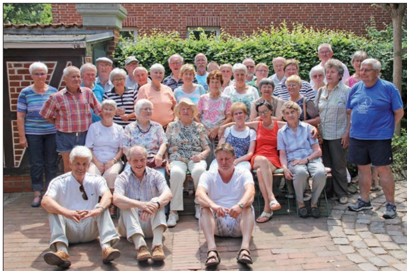
Teilnehmer beider Vereine am Riemannhaus vor der Rückfahrt nach Friedland.

Ausflugsschiff einzuschiffen. Die Fahrt führte auf der Trave hinein in die Hansestadt Lübeck. Mit dem Zug ging es dann am Nachmittag zurück nach Eutin. Am Abend fanden sich die Sportlerinnen und Sportler zur Jubiläumsfeier im Riemannhaus ein. Nach den Reden, in denen auf die Entstehung der Partnerschaft und Vertiefung der Beziehungen sowie die Festigung der über die Zeit entstandenen Freundschaften erinnert