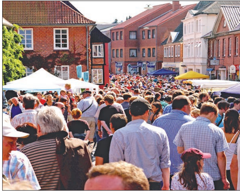
Wie auch in den letzten dreißig Jahren werden wieder zahlreiche Besucher beim traditionellen Großflohmart erwartet.

Dachboden oder Keller entrümpeln und damit auch noch Geld verdienen möchte, sollte sich jetzt seinen Stand sichern. Auch für die Teilnahme am Kinderflohmart (nur am Sonntag, 16. August, Straße Am Rosengarten) sollte man sich frühzeitig anmelden. Die wichtigsten Regeln für die Kids sind: Die Teilnahme am Kinderflohmart ist auf Kinder im Alter zwischen 6 und 14 Jahren begrenzt, wobei Erziehungsbeauftragte ihre Kinder beaufsichtigen dürfen. Der Verkauf ist