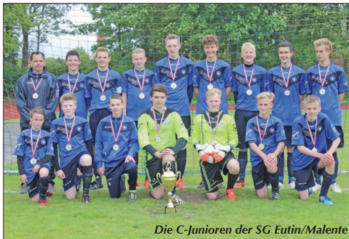
Die C-Junioren der SG Eutin/Malente