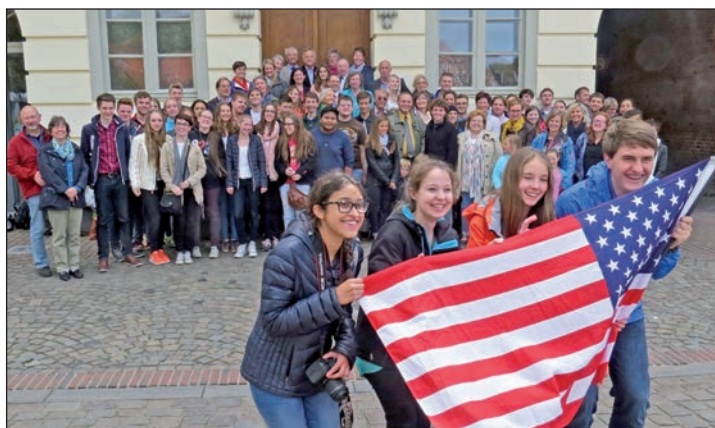
Die jungen Gäste aus USA und ihre Eutiner Gastgeber vor dem Rathaus.

zwei High Schools der Partnerstadt werden vier Wochen lang an der Voß- oder Weber-Schule am Unterricht teilnehmen und so ihre Deutsch-Kenntnisse verbessern. Im Gegenzug werden sie im Herbst einer gleichen Zahl Eutiner Schüler(innen) in Lawrence Gelegenheit geben, deren Englisch, bzw. Amerikanisch aufzupolieren. - Außerdem sind drei Praktikanten aus Lawrence „eingeflogen“, die an der Fachhoch-